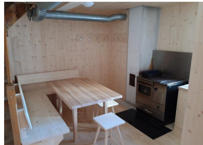
Der neue Winterraum

... mit Festreden, Hüttengaudi, Berggottesdienst und Jazz